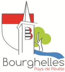
Commune de Bourghelles