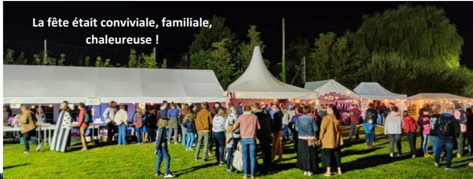
La fête était conviviale, familiale, chaleureuse !